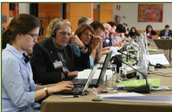
Discussion en plénière

Pour s'assurer le soutien du public, les syndicats d'enseignants devraient améliorer la perception qu'a le public de la profession enseignante, et faire davantage prendre conscience de l'importance que revêtent la santé et la sécurité des enseignants.